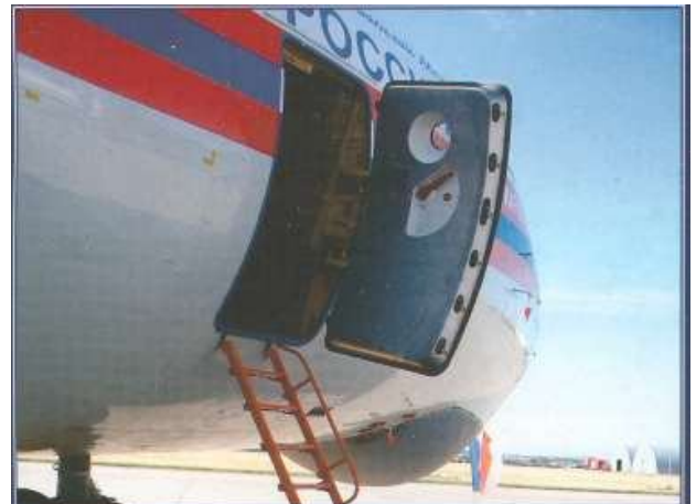
Дверь на правом борту фюзеляжа. При десантировании она, как козырек, прикрывает парашютистов от набегающего потока воздуха