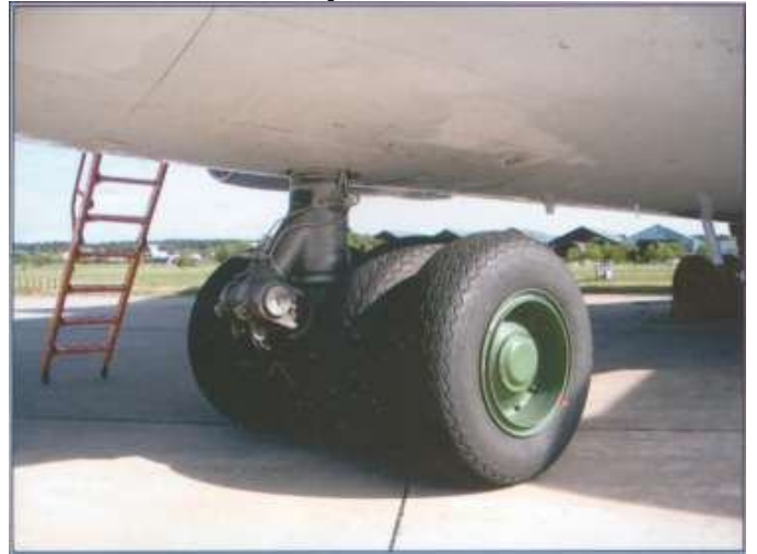
Носовая опора шасси