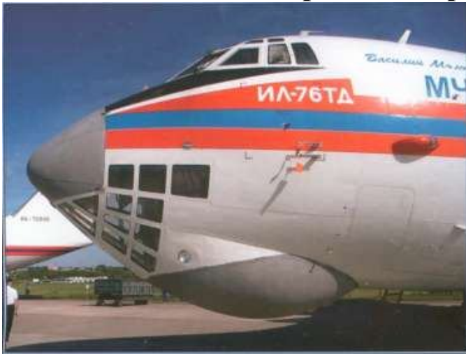
Носовая часть фюзеляжа Ил-76ТД