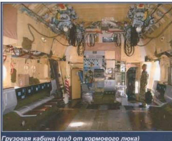
Грузовая кабина (вид от кормового люка)