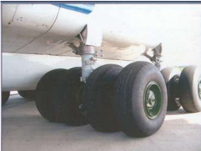
Основные опоры шасси (левая сторона фюзеляжа)