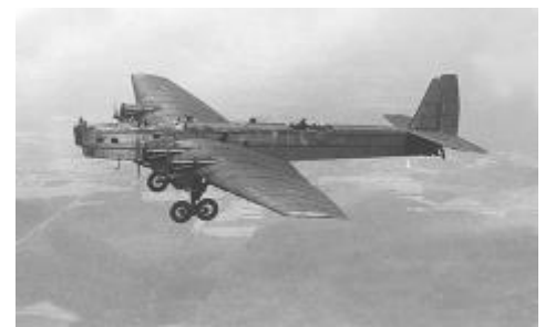
Тяжелый бомбардировщик ТБ-3