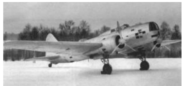
Дальний бомбардировщик ДБ-3Б