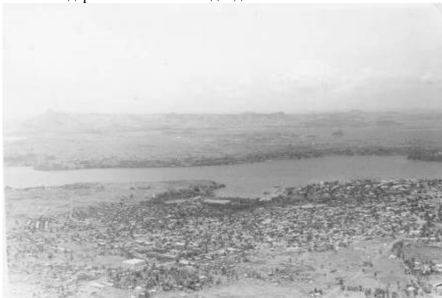
Мадагаскар, 1985 год, г. Антсиранана (г. Диего-Суарес), за проливом - аэродром.

Местное командование обратилось к нам с просьбой выполнить полет на аэродром Самбава на северо-востоке острова. По посадочному весу самолета он нам подходил, но полоса была всего 1250 м, заход осложнялся высокими деревьями в зонах подхода.