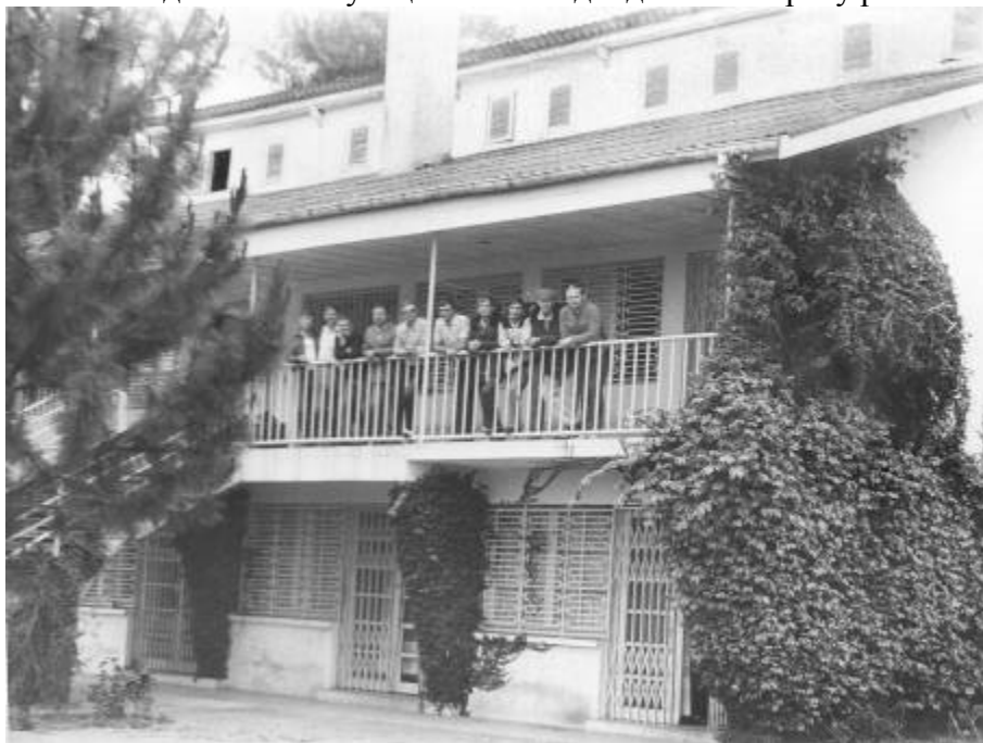
Антананарива. Вилла группы Ан-12 до 1985 года

Позже мы освоили Самбаву. Это, пожалуй, был самый сложный аэродром: длина ВПП 1200 м, высокие деревья по курсу взлета и посадки. Поэтому тщательно подходили к вопросу расчета взлетного веса.