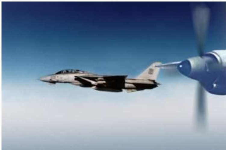
Встреча с палубными истребителями F-14 над Индийским океаном 28.09.1984г