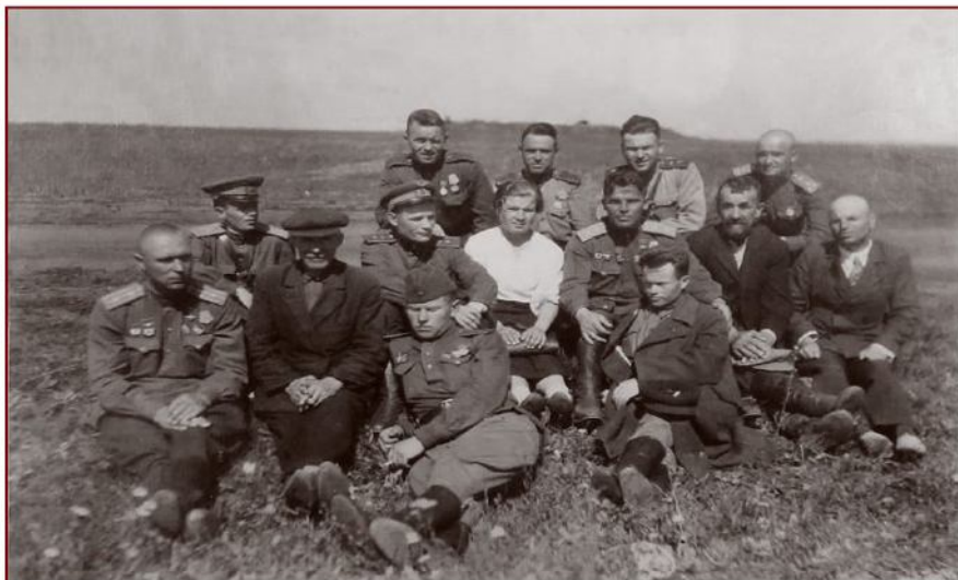
Представители Устюжны с авиаторами 1 гв. авиад. аэр.Никифоровка, август 1943 года