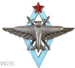
Знак об окончании авиационного училища до 1945 г.