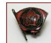
Знак КИМ (1922-1944 г) Коммунистический интернационал молодёжи