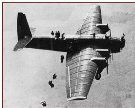
Высадка десанта с тяжелого бомбардировщика ТБ-3