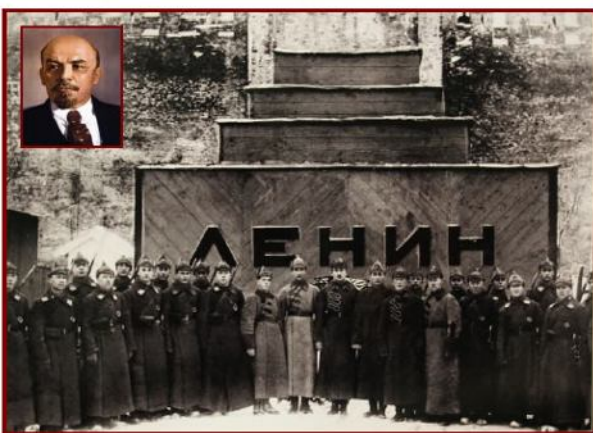
Почётный караул 1-ой Советской объединённой военной школы РККА имени ВЦИК по охране временного мавзолея Ленина, Фото 1924 г

С 1931 по 1934 год Василий Михайлович Чистяков обучался в Тамбовской объединённой кавалерийской школе.