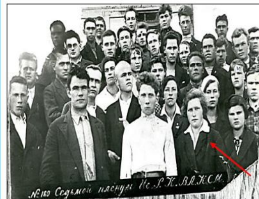
Пленум РК КИМ п.Ис Фото: 1935 года